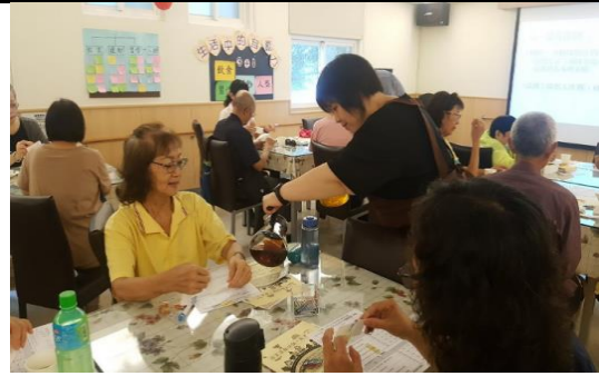
金山金包里公共托老中心