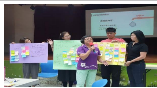
108.9.19 社區輪流發表討論結果