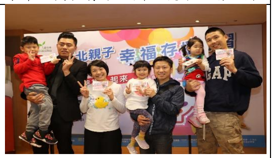
新北市舉辦「親子幸福存摺集點大