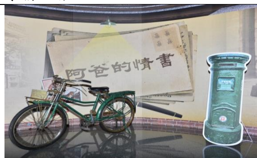
「阿爸的時光列車」～新北市 108 年度模範父親表揚大會阿爸的情書