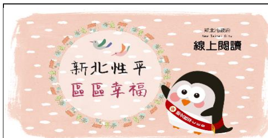
「新北性平 區區幸福」故事書

(2) 透過此書宣導本市性平亮點方案，提升政策執行者及一般民眾性平意識，並將性平觀點融入並落實在日常生活中；另書中亦提供本市各項福利資源補助之資訊，並可提升福利服務的可及性，協助解決民眾之經濟及照顧問題。