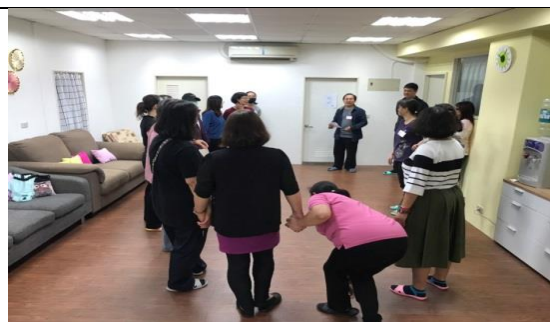
單親家庭支持性活動-凝聚支持工作坊