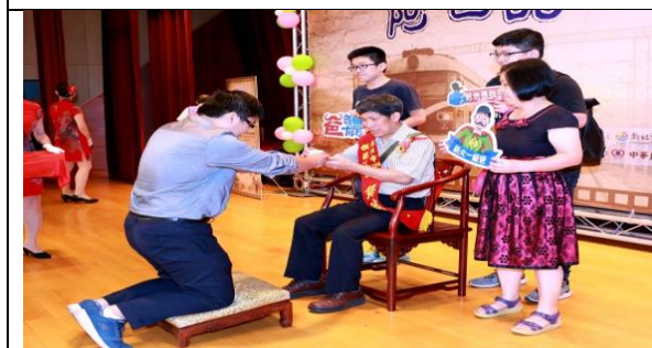
「阿爸的時光列車」～新北市 108 年度模範父親表揚大會孝親堂