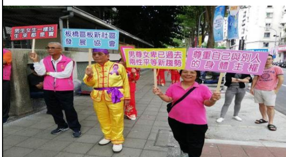
108.11.3 「性別平等宣導踩街活動」