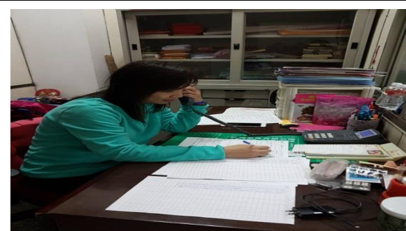
單親家庭關懷諮詢服務站-電話關懷服務