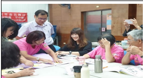
108.9.19 由性平專家帶領，社區針對設定的討論問題彼此腦力激盪