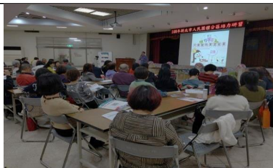
分區研習性平宣導