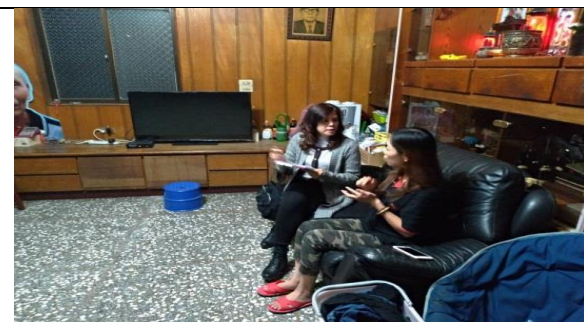
單親家庭關懷諮詢服務站-關懷訪視服務