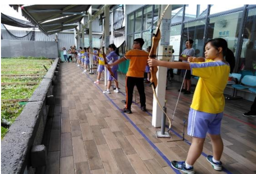
結合勵馨基金會辦理新北女孩運動會