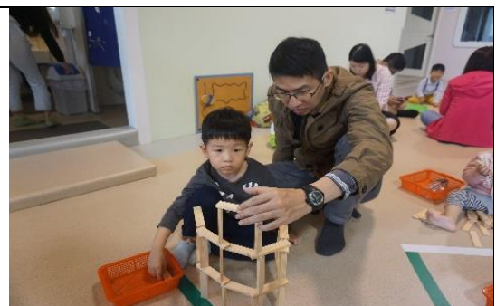
本市公共托育中心辦理親子活動照片