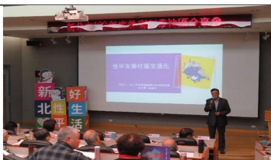
108.12.26 新北市 108 年度性別友善社區分享會板橋區龍興社區經驗分享