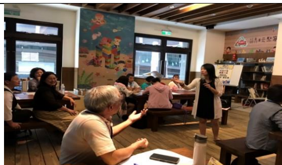
金星領航員性平 1/3 課程