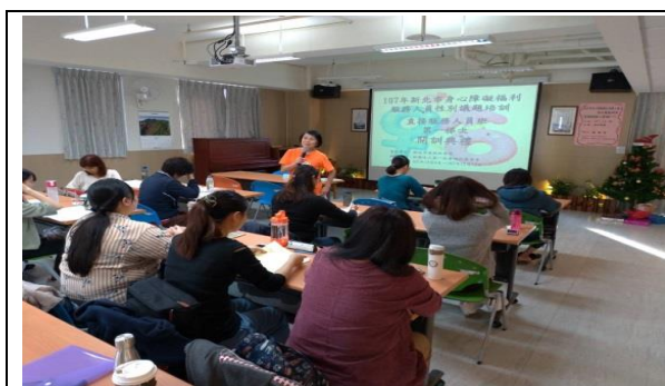
107 年 11 月 1 日管理階層班 「心智障礙者性教育概論」課程