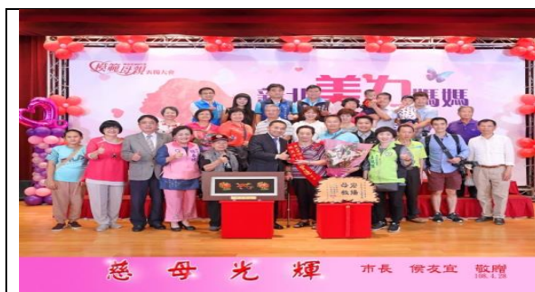
「新北美力媽媽 照亮心幸福」～新北市 108 年度模範母親表揚大會市長頒獎

計表揚 59 位模範母親代表及 57 位模範父親代表，翻轉大多數人對媽媽及爸爸的刻板印象，共有多則新聞露出，藉此讓大眾知道，教養子女是父母的共同責任，女性並不一定是主要家庭照顧者，男性也不一定是一肩扛起家庭經濟的絕對角色，打破過往思維，倡導性別平等思維。