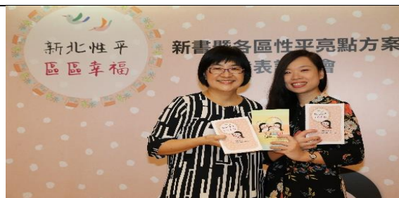
「新北性平 區區幸福」故事書宣傳記者會

(除本府性別主流化實施計畫所規定應辦理事項外，機關構自行推展之促進性別平等相關行為，若無則免。)