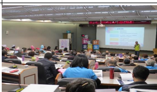
108.12.26 新北市 108 年度性別友善社區分享會瑞芳區龍川社區經驗分享