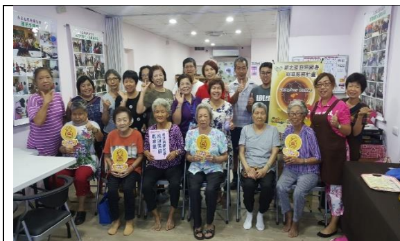
社區關懷據點、銀髮俱樂部活動照片

(2) 銀髮俱樂部 3.0(原社區照顧關懷據點陪伴站)：以照顧咖啡館的概念，用巡迴方式進入本市 29 區，提供咖啡飲品營造溫暖放鬆的氛圍，並由專業講師至銀髮俱樂部 3.0(原社區照顧關懷據點陪伴站) 帶領心理支持、人際互動、照顧技巧、疾病認識、健康促進等課程，增進照顧者照顧自己及照顧家人的能力，減輕照顧負擔，促進照顧者身心健康，減輕照顧壓力，總計巡迴 51 場次，並辦理 1 場工作人員培力課程，學習自主辦理家庭照顧者支持服務。共 1,378 人次受益，其中女性 1,193 人次(佔 89%)、男性 147 人次(佔 11%)。