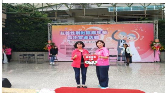
108.11.3 永和區民權社區發展協會「性別友善社區嘉年華」授牌及成果展演