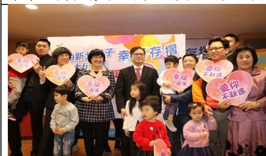
新北市舉辦「親子幸福存摺集點大