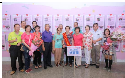
「新北美力媽媽 照亮心幸福」～新北市 108 年度模範母親表揚大會故事牆互動區