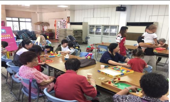
單親家庭支持性活動-玩具車親子活動