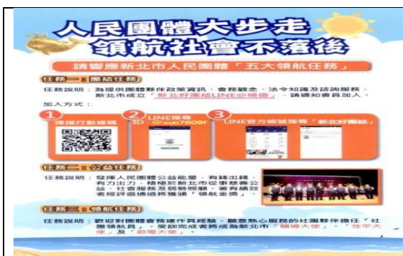
人民團體性平 1/3 宣導 DM 正面

1. 理監事單一性別不低於 1/3 列入章程：截至 108 年 12 月底計累計有 400 個人民團體業於會員大會通過，已達目標值 100%。 跨局處推動團體修訂章程，將「理監事單一性別不低於 1/3」納入章程規定，截至 108 年 12 月 31 日止計有城鄉局、衛生局等局處參與推動，對 11 個團體進行宣導，並有新北市旅館商業同業公會、新北市民宿發展協會、新北市溫泉觀光協會等 3 個團體將配合政策修訂章程。