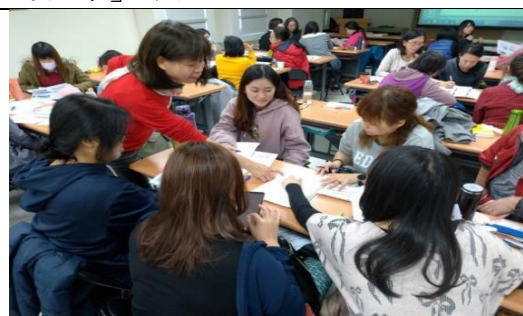
108 年 1 月 17 日第 2 梯次直接服務 人員班「心智礙者性教育課程設計 及教材教法」 研討

2. 針對機關業務研發一般性平意識概念或 CEDAW 之教材或案例彙編，並上傳所屬性別主流化專區。