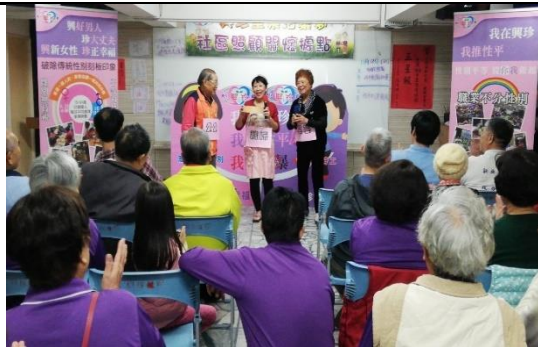
108.12.12 五股區興珍社區發展協會 「一塊年糕踩出性別平等的幸福人生」行動短劇