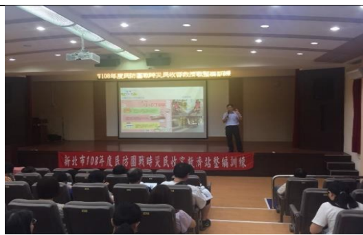
6 月 13 日及 6 月 20 日於新店區文化劇場辦理民防團訓練