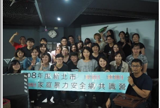
辦理第三區網絡共識營

3. 於各類補助、獎勵、徵選及評鑑企業、鄰里社區、區公所、所屬機關(構)與民間組織之計畫或方案等，納入對象若有推動性別平等之事項得以加額補助、優先補助、加分等積極獎勵作為。