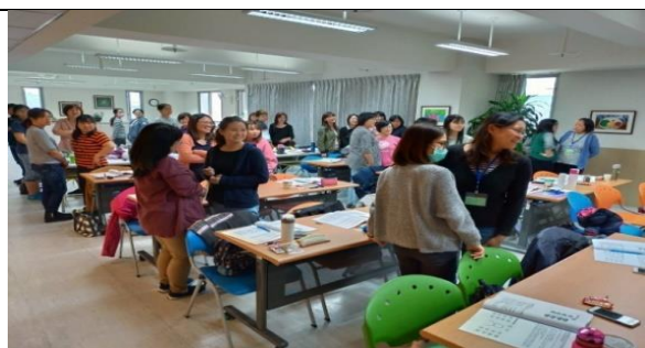
108 年 1 月 10 日第 2 梯次直接服務人員 班「心智障礙者的性健康照顧、交友與 婚姻議題」研討