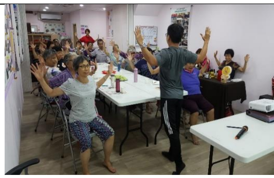
社區關懷據點、銀髮俱樂部活動照片