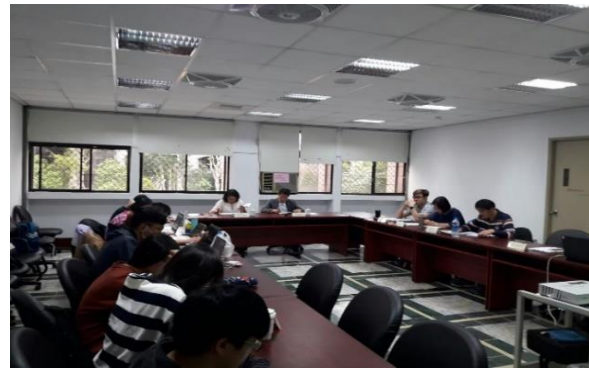
召開網絡聯合評估會議