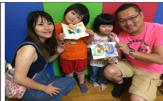
本市公共托育中心辦理親子活動照片