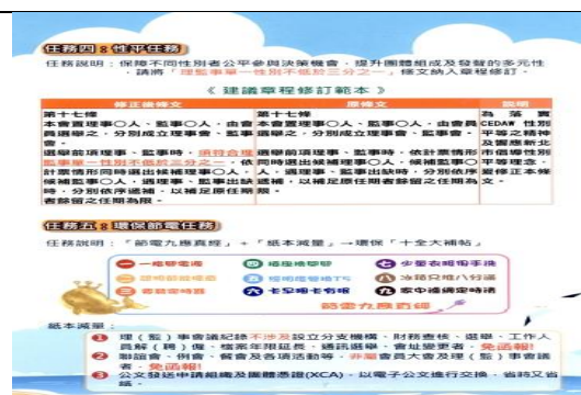
人民團體性平 1/3 宣導 DM 反面