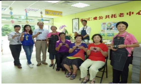
林口仁愛公共托老中心