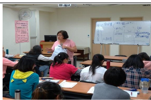
107 年 12 月 6 日第 1 梯次直接服務 人員班「心智障礙者性相關行為問 題輔導」課程