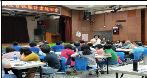
108.9.4 王如玄律師「性別友善意識培力」