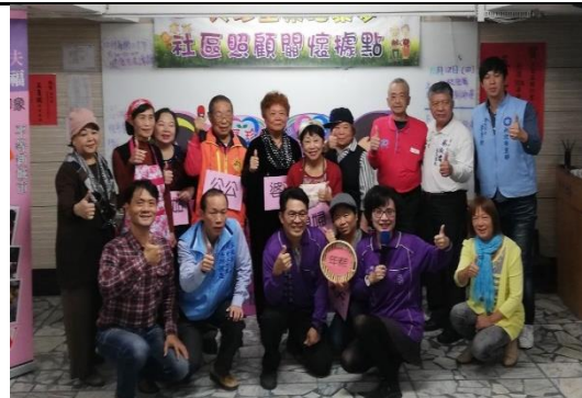
108.12.12 五股區興珍社區發展協會 「一塊年糕踩出性別平等的幸福人生」