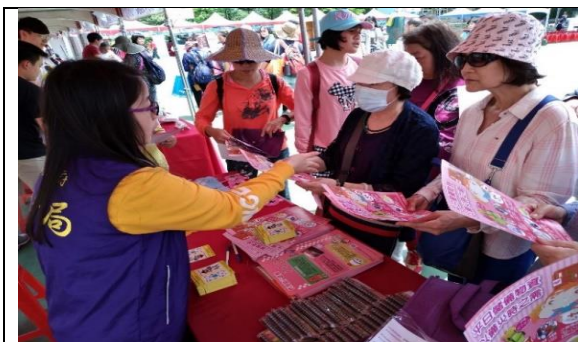
4 月 20 日於金山高中辦理防災園遊會