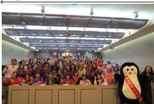
108.12.26 新北市 108 年度性別友善社區分享會